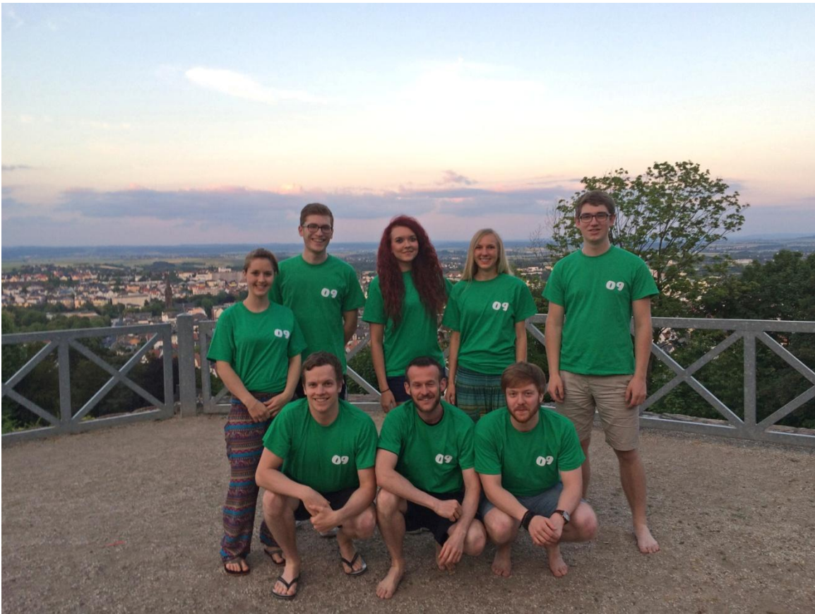
Die Fachschaft 09 auf Exkursion - Bad Nauheim im Juni 2015

Ja, wir wissen, dass Du in der letzten sowie in der kommenden Zeit mit Informationen nur so überschüttet wirst. Für Dich ist das jetzt erst einmal ein Neuanfang, hierzu gehören auch die Stadt (Gießen) und Deine Kommilitonen. Wir haben versucht zwischen Informativem und Unterhaltsamem zu wählen, um Dir die Eingewöhnung an der Universität, unserem Fachbereich und in unserer gemeinsamen neuen Heimatstadt etwas zu erleichtern. Wir wünschen Dir auf jeden Fall viel Spaß damit, einen guten Start ins erste Semester sowie eine wunderschöne, interessante und bildende Zeit in Gießen.